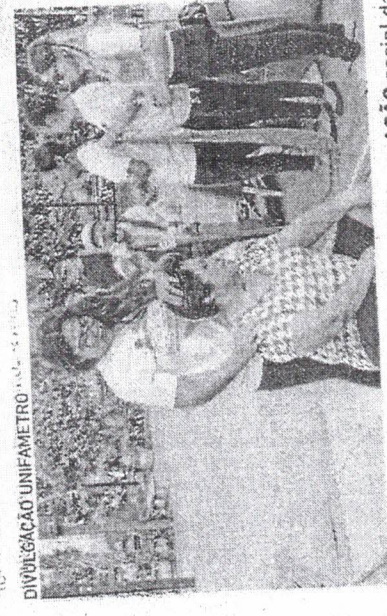
ACÃO SOCIAL Unifametro com a comunidade

No processo de produção do aço são gerados vários resíduos: escória de Aciaria e de Alto-forno, lama, pós, resíduos refratários e resíduos metálicos. A CSP consegue reaproveitar quase 100% dos resíduos e, ainda, comercializa coprodutos para cimenteiras, para indústrias de cerâmicas, químicas, como tintas, pavimentação de pátios e vias. Esse reaproveitamento reduz custos e aumenta a sustentabilidade do negócio.