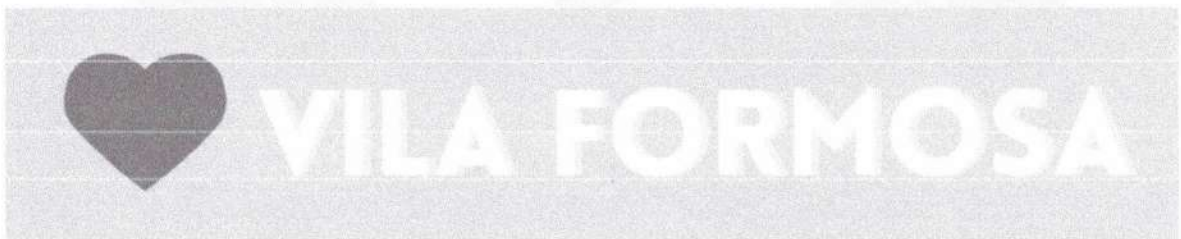
Imagem 01: Frase letreiro em ACM

Será confeccionado letras em ACM medido altura de 80 cm das palavras: VILA FORMOSA (cor branca); e do SÍMBOLO DE CORAÇÃO (cor vermelho). A frase montada deverá ser instalada obre base de concreto de forma segura.